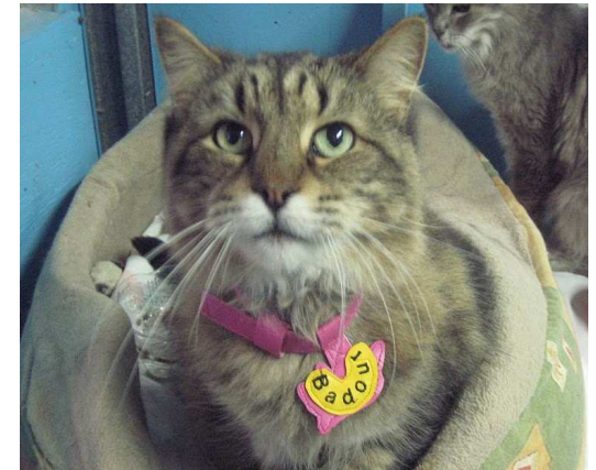
Badour, en attente de parrainage

Réseau Secours Animal Le plus grand refuge pour chats sans euthanasie à Montréal